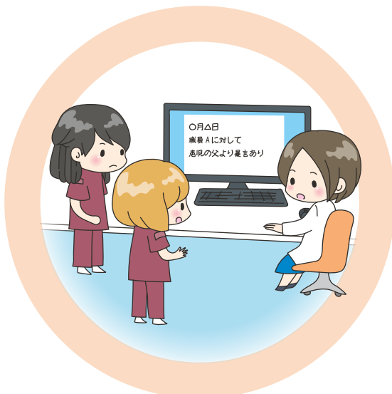
case 4 暴力内容について情報共有