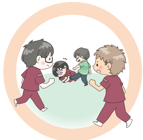
case 3 発生時に複数人で対応する