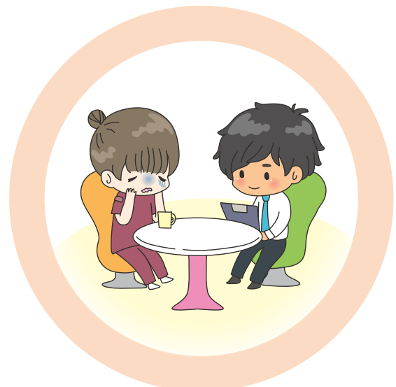
case 5 被害に遭った職員のケア