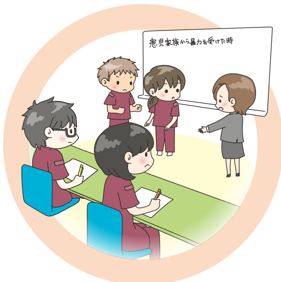
case 2 研修・訓練の実施 シュミレーションパッケージの導入