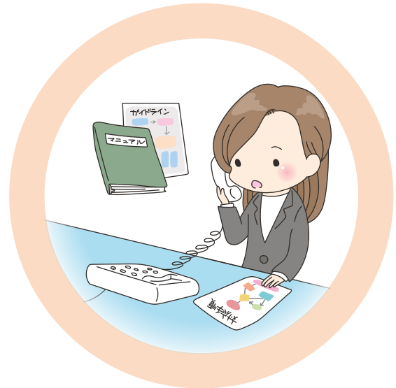
case 1 マニュアル・ガイドライン の作成